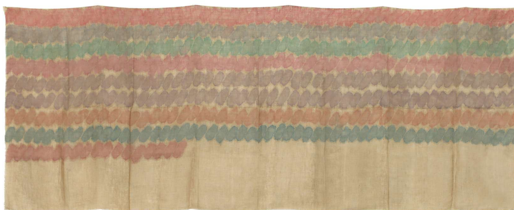
Giorgio Griffa, Segni orizzontali policromo, 1973, acrilico su Juta, cm 100x293