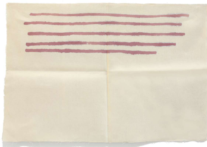
Giorgio Griffa, Linee orizzontali, 1979, acrilico su cotone cm 61x91