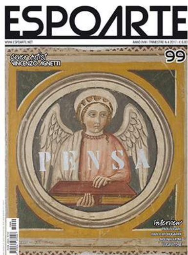
( https://www.espoarte.net/in-evidenza/espoarte-99-trimestre-n-4-2017/ )