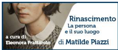
( http://www.cubounipol.it/ )