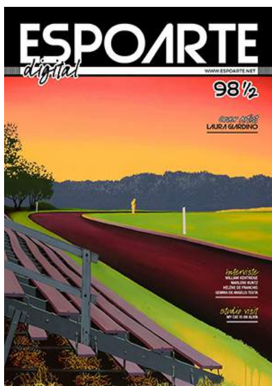
( http://bit.ly/espodigital98mezzo )