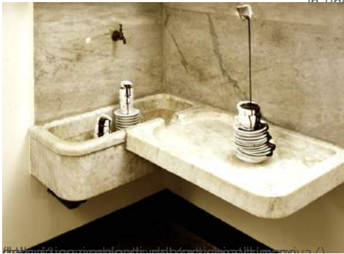
MATILDE DOMESTICO. AMBIENTE DOMESTICO (A.D. MMXI) | GALLERIA NAZIONALE DI PALAZZO SPINOLA, GENOVA ( HTTP://WWW.ESPOARTE.NET/ARTE/MATILDE-DOMESTICO-AMBIENTE-DOMESTICO-A-D-MMXI-GALLERIA-NAZIONALE-DI-PALAZZO-SPINOLA-GENOVA/ ) EDITOR ( HTTP://WWW.ESPOARTE.NET/AUTHOR/ELENA/ ) x 26 MAGGIO 2011