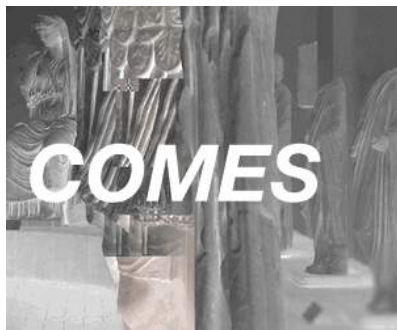
( https://www.forevernevercomes.com/ )