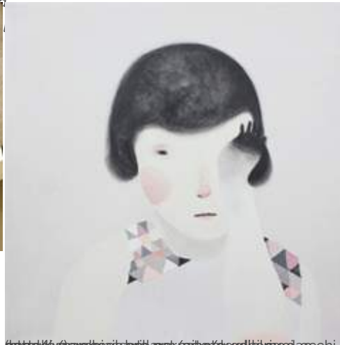
GUGLIELMO CASTELLI. PERCHÉ IL BRILLARE NATURALE DEI SUOI OCCHI NON LO SCAMBIASSERO PER PIANTO. GALLERIA DAC, GENOVA ( HTTP://WWW.ESPOARTE.NET/ARTE/GUGLIELMO-CASTELLI-PERCHE-IL-BRILLARE-NATURALE-DEI-SUOI-OCCHI-NON-LO-SCAMBIASSERO-PER-PIANTO-GALLERIA-DAC-GENOVA/ ) REDAZIONE ( HTTP://WWW.ESPOARTE.NET/AUTHOR/REDAZIONE/ ) x 1 DICEMBRE 2010