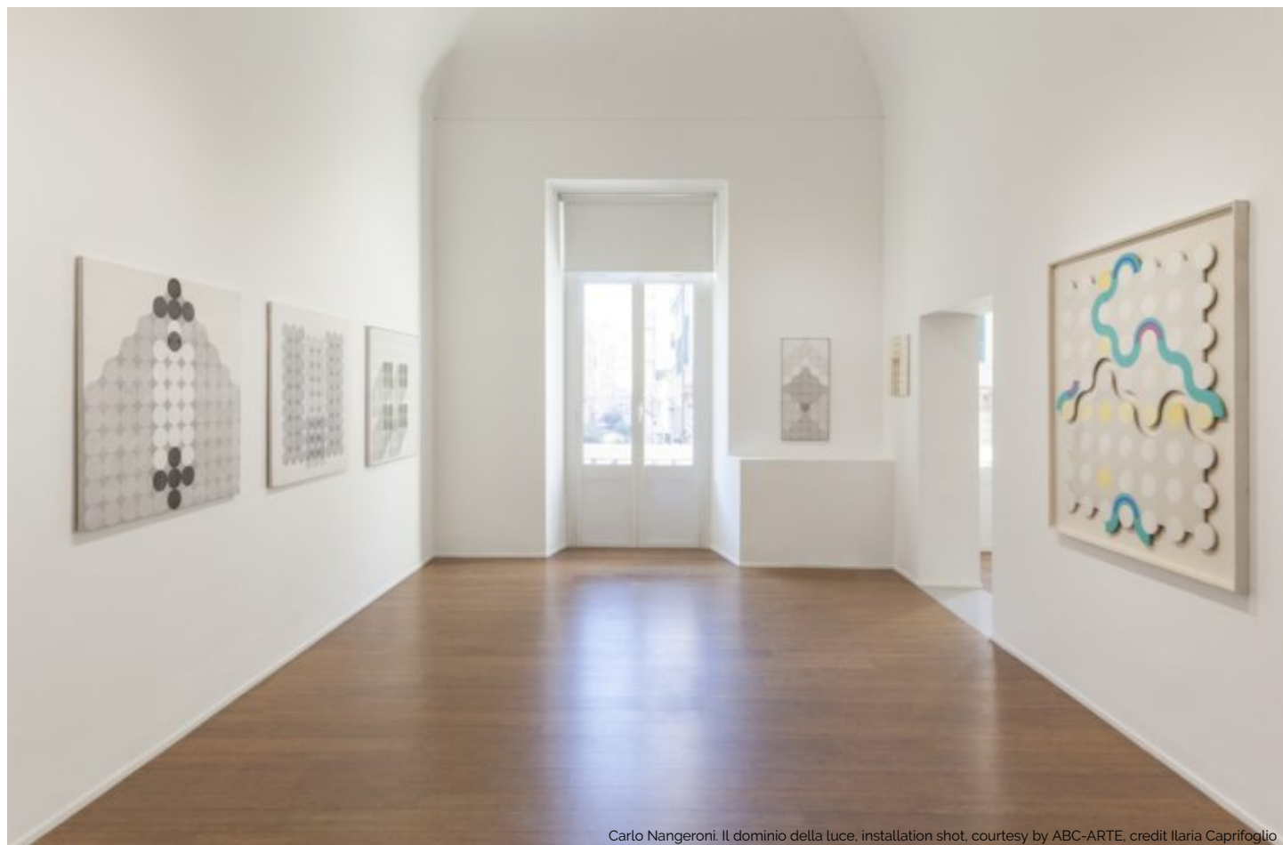
Carlo Nangeroni. Il dominio della luce, installation shot

evidenza/espoarte-103-trimestre-n-4-2018/ )