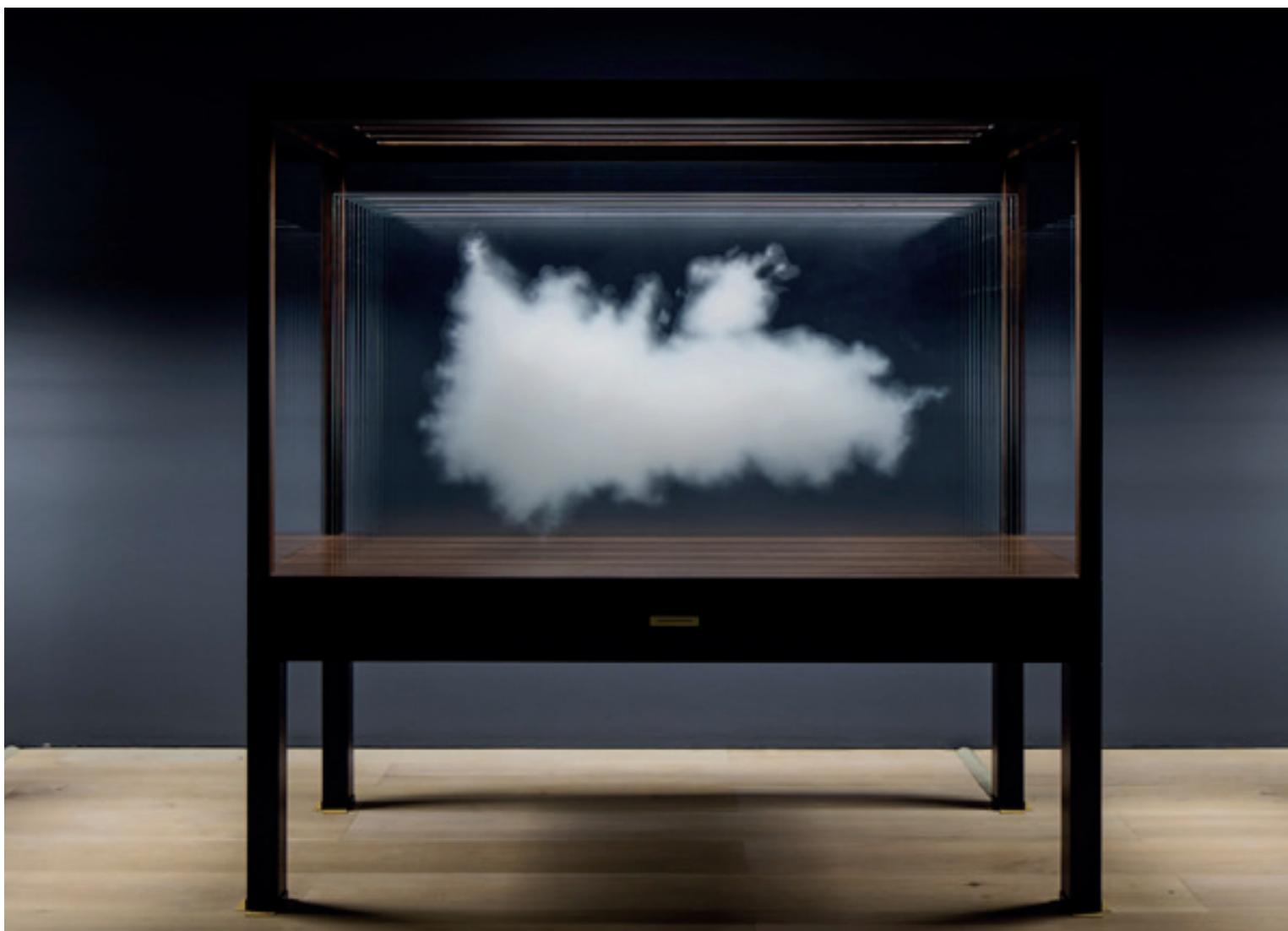
Leandro Erlich, Cloud (UK 2016) Vetro ultra chiaro, inchiostro di ceramica, legno, luce Mori Art Museum, Tokyo (Japan 2017)

LA FIERA D'ARTE DI BOLOGNA, GUIDATA DA SIMONE MENEGOI, PUNTA SULL'ITALIANITÀ APERTA SEMPRE DI PIÙ AL CONTESTO INTERNAZIONALE, PROMUOVENDO LE NUOVE GENERAZIONI ACCANTO AGLI ARTISTI STORICIZZATI