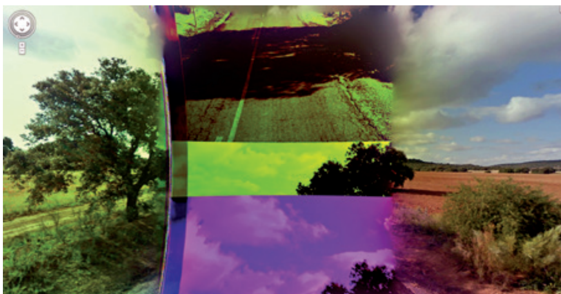
Emilio Vavarella , The Google Trilogy "Report a Problem" Serie di 100 immagini