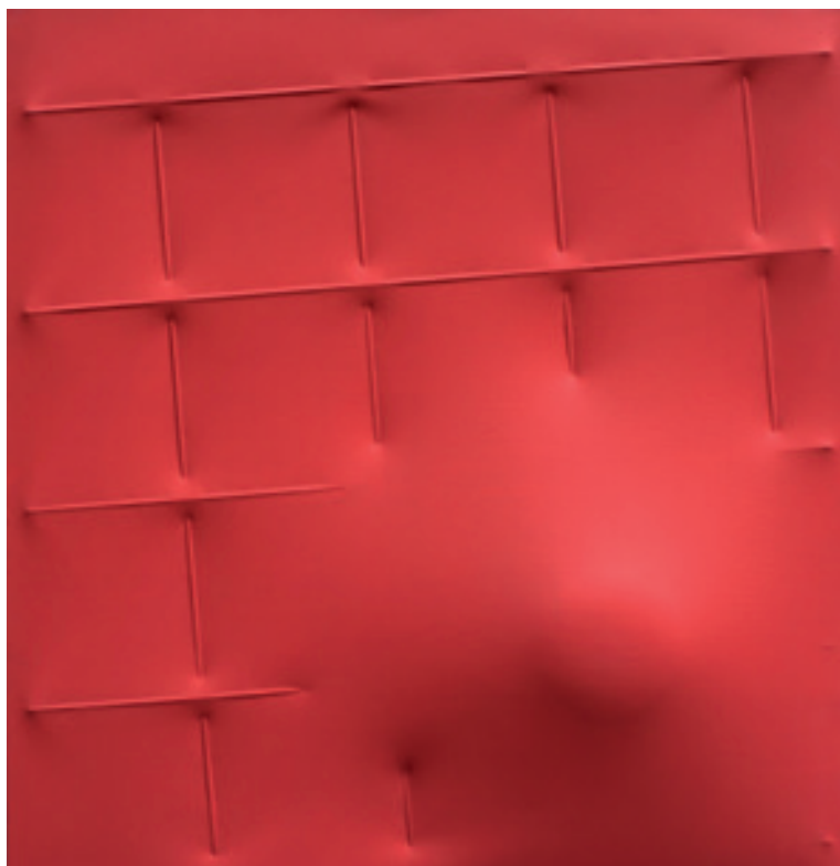
Agostino Bonalumi, Rosso (2008) Tela estroflessa e acrilico

appartenendo a una generazione cresciuta con la globalizzazione, e per necessità, date le opportunità di formazione e di affermazione che offrono altre nazioni. Al tempo stesso, non dimenticano le proprie origini, sia in termini di storia dell'arte sia del paesaggio (fisico e antropologico) del Belpaese; e non temono di farne l'oggetto della propria opera, o almeno il punto di partenza. Dopo Cattelan, i giovani artisti italiani non hanno, insomma, più imbarazzi a mostrarsi italiani».