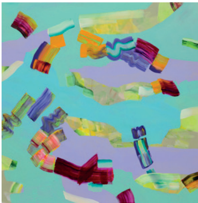
Isabella Nazzari, Sublimazione di una valle (2017) Acrilico e pigmento su tela

A Bologna ci attende, quindi, un focus sul moderno e sull'arte postbellica, oltre a un ampio sguardo alle tendenze contemporanee, a partire dalle proposte di ricerca degli artisti emergenti italiani. Qual è il loro identikit? Risponde Menegoi: «Sono cosmopoliti per vocazione,