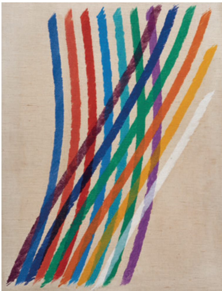
Piero Dorazio, Gagliarda (1965) Olio su tela

I talo Calvino? Le Lezioni americane ? La leggerezza è la prima associazione di idee che viene spontanea, pensando a questo suo libro postumo. Prendere la vita con leggerezza. «Che leggerezza non è superficialità, ma planare sulle cose dall'alto», per dirla con le sue parole. Tutto ciò, lo sappiamo, ha avuto successo, tanto da diventare persino un modo di dire. Ma rappresenta soprattutto, a mio avviso, un invito – sempre attualissimo – a esercitare diversamente il nostro sguardo e i nostri sensi per superare le apparenze intorno a noi e le loro leggi fisiche. Facile a dirsi, difficile però a realizzarsi. In questo, tuttavia, ci può venire in soccorso l'arte contemporanea che applica questo stesso modello di pensiero "divergente". E, per farne una vera e propria full immersion, l'appuntamento è a Bologna. Ad Arte Fiera. Prima fiera d'arte ad aver aperto in Italia, è la prima anche nel calendario artistico 2019 (1-4 febbraio). Strategica nella sua collocazione geografica, si candida per tornare a essere un punto di riferimento del mercato nostrano dell'arte. Missione non facile per il suo nuovo capitano