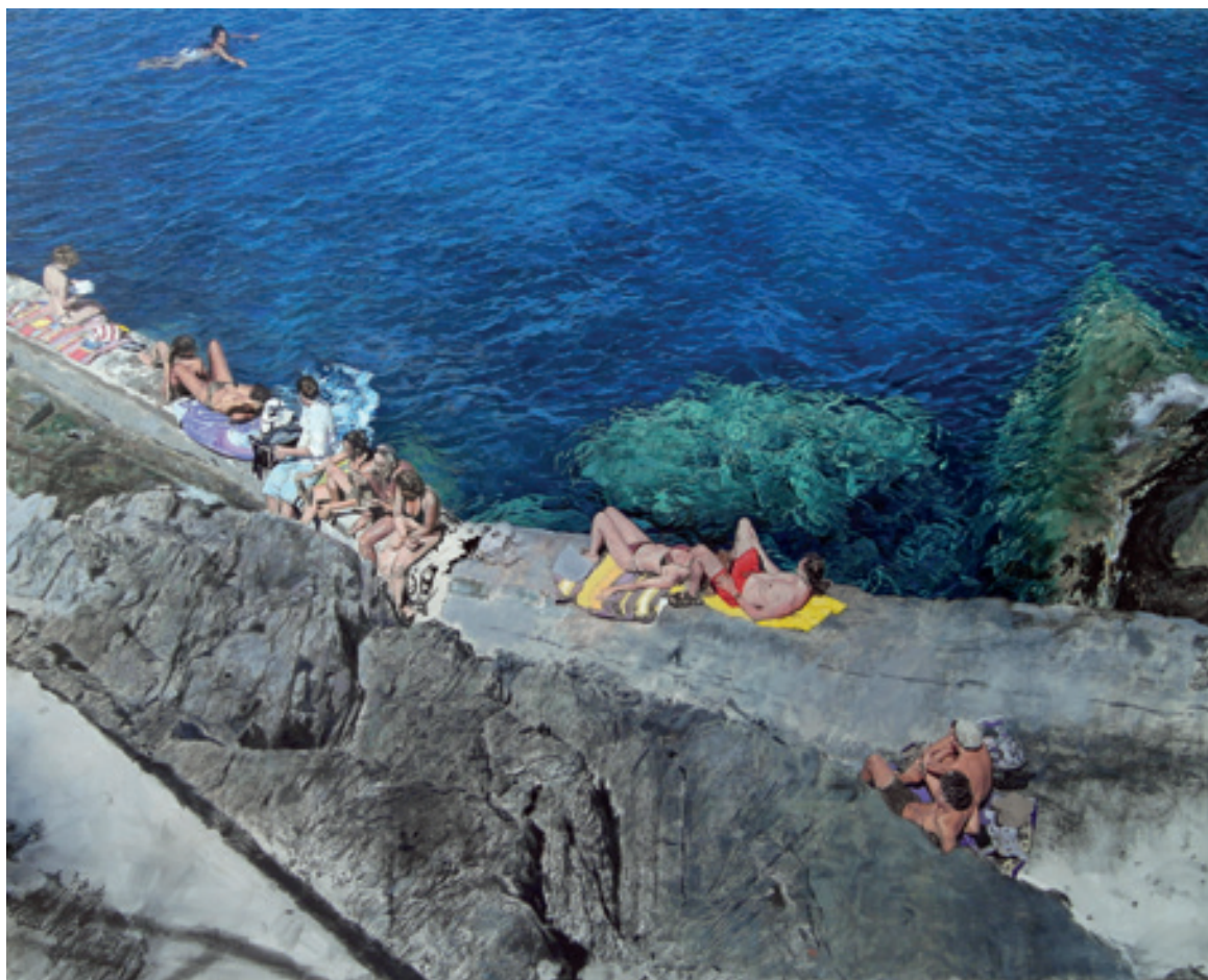
Giovanni Iudice , Sea inside 1 (2018) Olio su tela