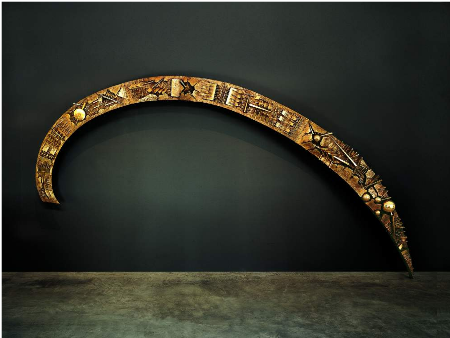
«Arco», 2000, di Arnaldo Pomodoro. © Arnaldo Pomodoro.