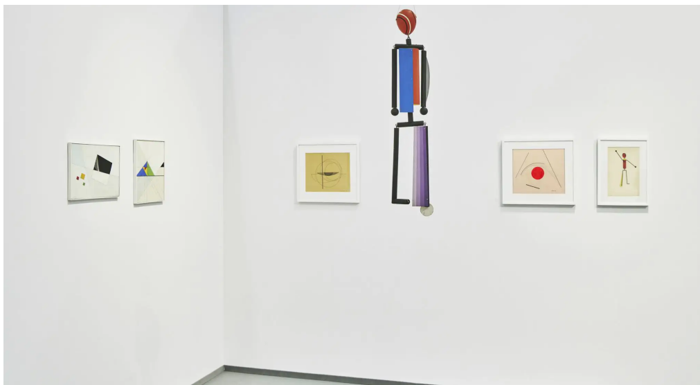
10 A.M. ART, Art Cologne, 2021

Coraggio, qualità e un pizzico di fortuna. Potremmo riassumere così la spedizione tedesca delle cinque gallerie italiane partite per Art Cologne 2021 . L'evento è certamente di prestigio, ma con una situazione pandemica che in Germania si fa ogni giorno più preoccupante, non era affatto scontato che la fiera si tenesse, ancora meno che i collezionisti accorressero subito attirati dalla pur ricca proposta.