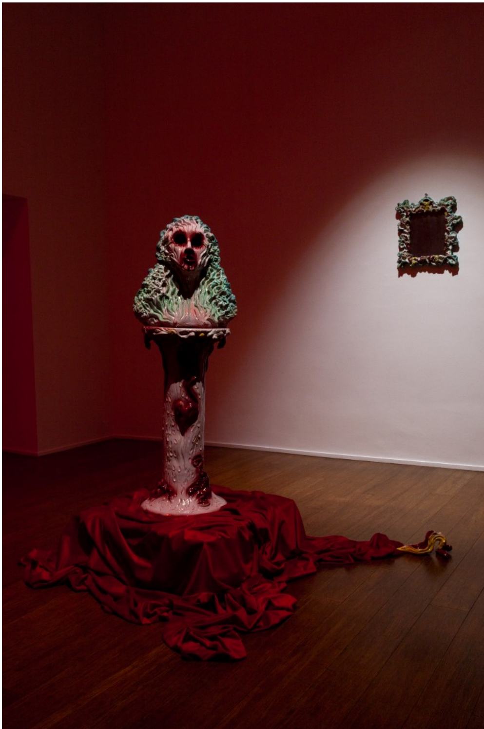
Zoe Williams – Capital vice – installation view