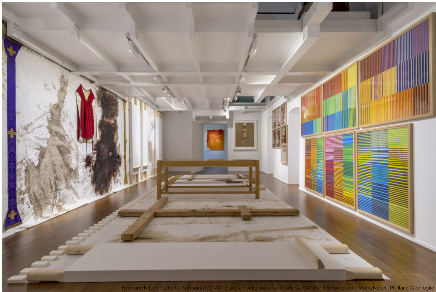
Hermann Nitsch, Cathartic Aversion, ABC-ARTE, 2023. Installation view.

(https://www.espoarte.net/in-evidenza/espoarte-121/)