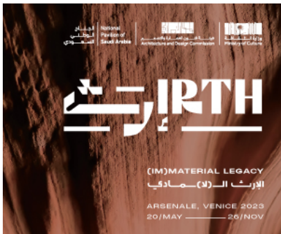
( https://bit.ly/saudipavilion2023 )