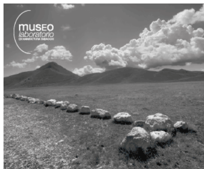
( https://www.museolaboratorio.org/la-natura-delle-cose/ )

Utilizziamo i cookie per essere sicuri che tu possa avere la migliore esperienza sul nostro sito. Se continui ad utilizzare questo sito noi assumiamo che tu ne sia felice.