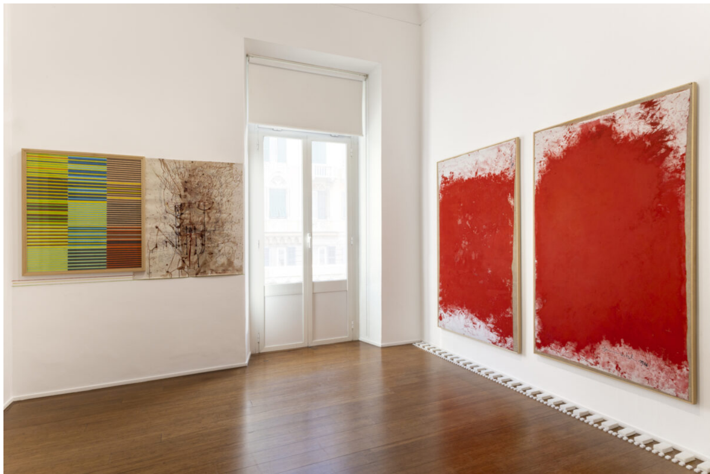
Hermann Nitsch. Cathartic Aversion , ABC-ARTE, 2023. installation view.

Catturano lo sguardo i relitti: residui oggettuali delle performance realizzate dall'artista che non rimangono oggetti inanimati ma vengono caricati di una nuova potenza narrativa e vitale in grado di far immergere i visitatori nell'universo filosofico, artistico e intellettuale di Nitsch stesso. Ampolle, strumenti chirurgici, fazzoletti, zuccherini bianchi e pigmenti naturali sono solo alcuni tra i residui delle azioni, crude e toccanti, progettate da Nitsch che permettono di provare sensazioni nuove. Il rosso sangue che spesso domina la scena – per l'autore scena teatrale – normalmente codificato come elemento tragico, richiamo alla morte e, di conseguenza, respingente, in Nitsch è utilizzato in quanto sinonimo di vita e origine dell'esistenza oltre che elemento in grado di guidare i fruitori in un percorso di comprensione dei misteri della vita e della morte.