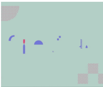
( https://www.ababo.it/activities/riparazioni/riparazioni-6156b7 )