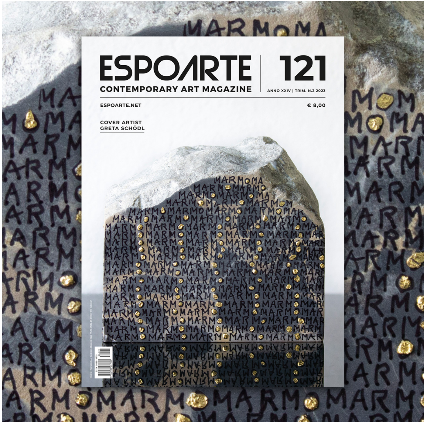
( https://www.espoarte.net/in-evidenza/espoarte-121/ )