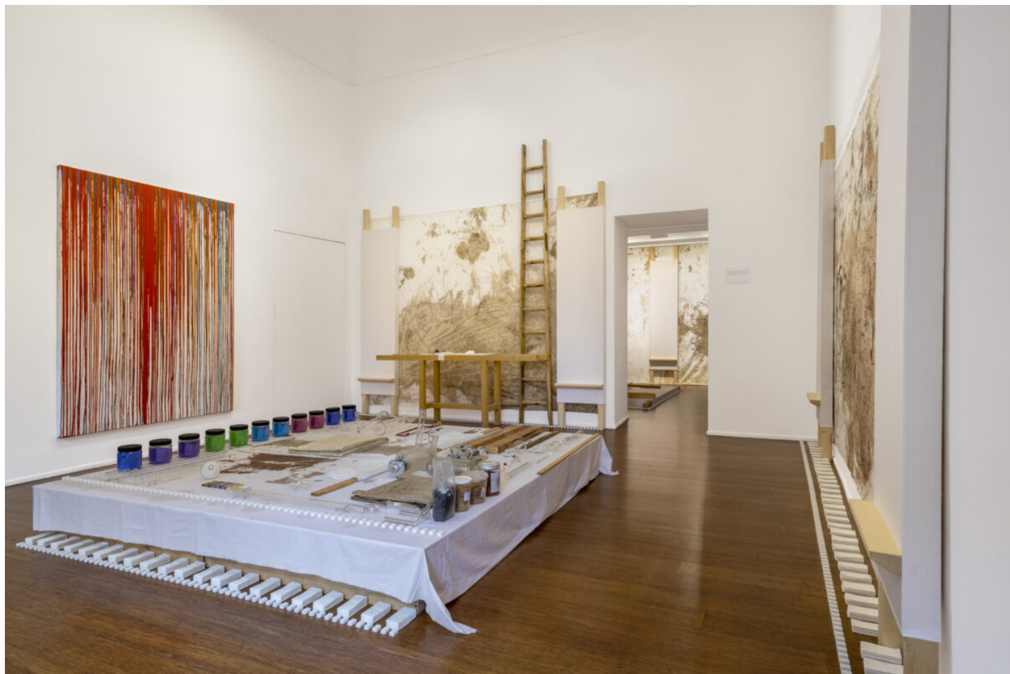
Hermann Nitsch. Cathartic Aversion , ABC-ARTE, 2023, installation view.

Un progetto espositivo coinvolgente realizzato grazie alla collaborazione di Antonio Borghese con Flaminio Gualdoni , curatore della mostra, ed il Museo Hermann Nitsch . Archivio Laboratorio per le Arti Contemporanee, fondato e diretto a Napoli da Peppe Morra , che a partire dal 1974 ha accompagnato l'opera di Nitsch e ne conserva materiali di primaria importanza.