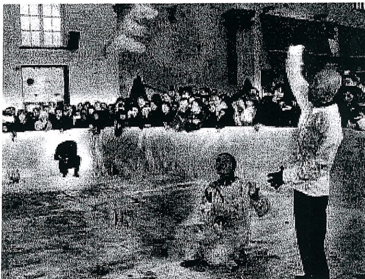
PER LA sua performance, andata in scena ieri pomeriggio a Palazzo Ducale , Shozo Shimamoto ha dipinto lanciando colori su una grande tela. Opere dell'artista sono a Villa Croce nella mostra "Shozo Shimamoto. Samurai, acrobata dello sguardo" a cura di Achille Bonito Oliva.

I KAZUTI AL BLU Il Blu di Ravecca in via di Ravecca 65r propone stasera, a partire dalle 22.30, la mu-