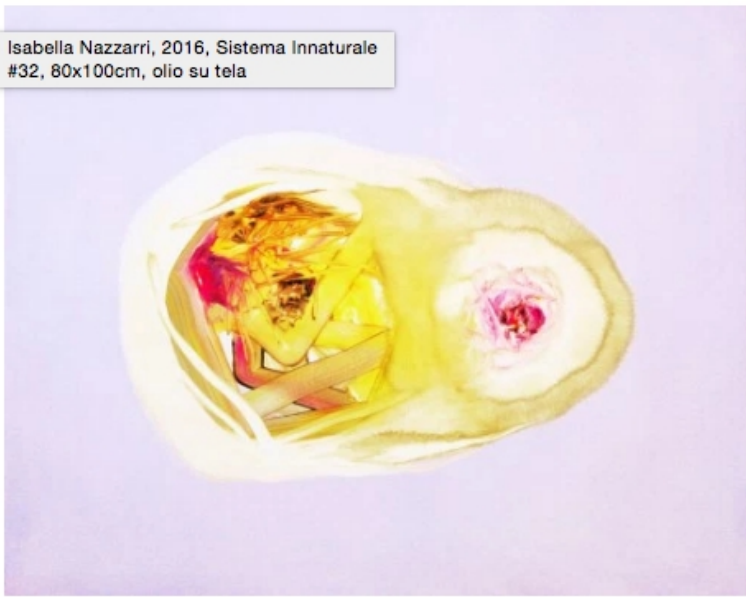
Isabella Nazzari, 2016, Sistema Innaturale #32, 80x100cm, olio su tela