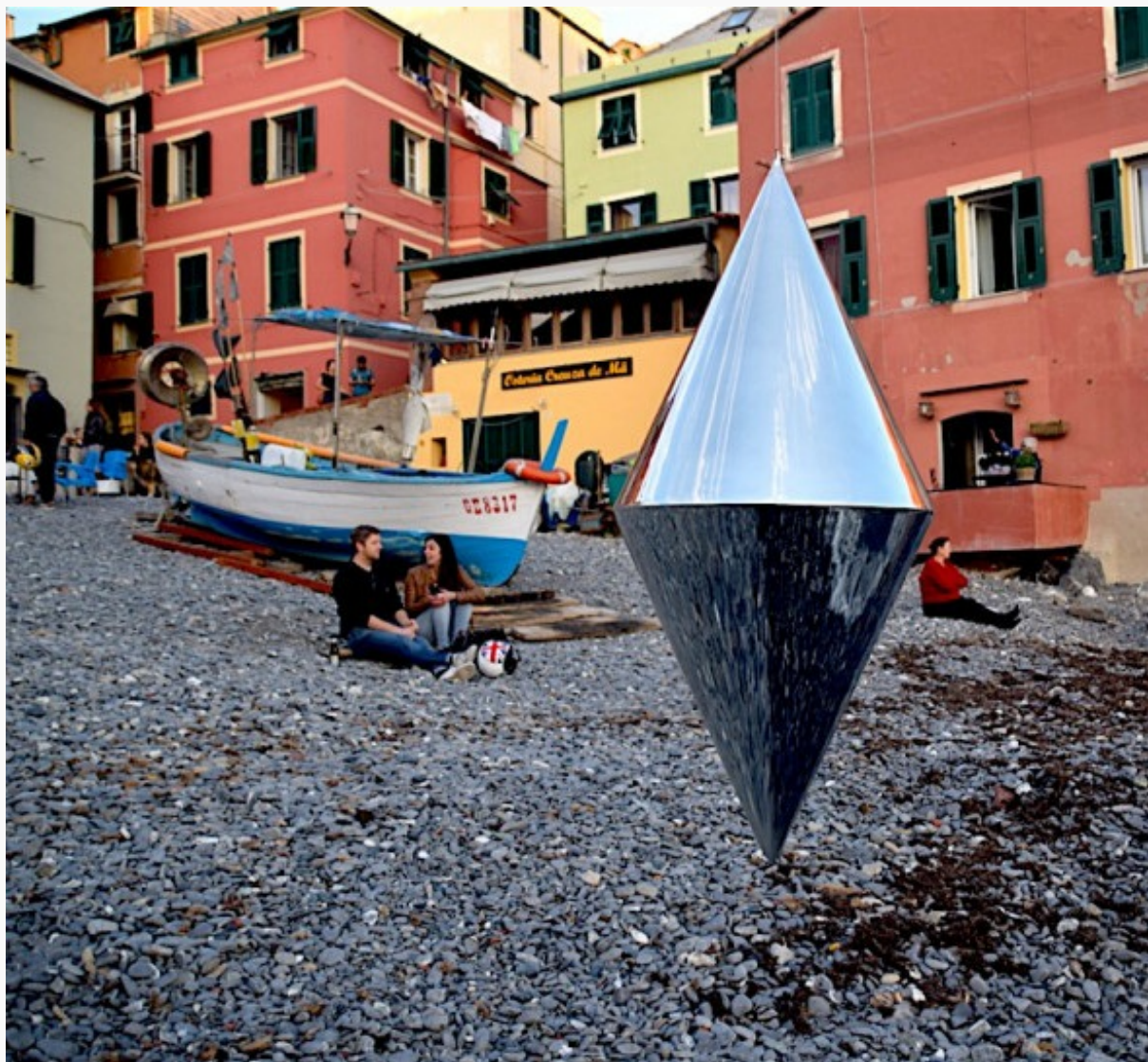
Matteo Negri, Navigator #Boccadasse, 2016, 15x22cm, stampa lambda su alluminio