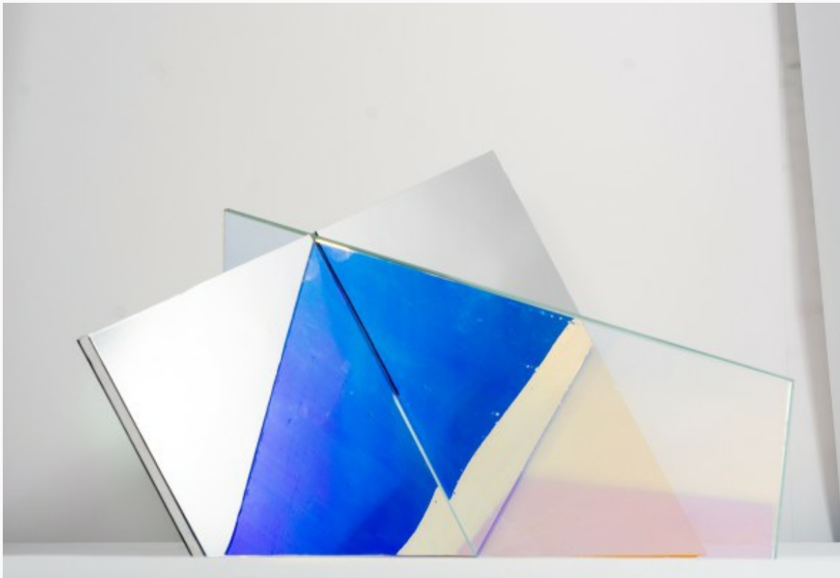
Matteo Negri, Piano Piano, 2016, 165x260x230, ferro, cromo liquido e vetro

La mostra personale di Matteo Negri “Piano Piano”, a cura di Alberto Fiz inaugura alla galleria ABC-ARTE di Genova il prossimo 11 novembre. Il titolo Piano Piano riassume in sé i concetti fondanti della ricerca elaborata dall'artista, il rapporto tra l'individuo e lo spazio rispetto ai lavori che includono l'osservatore, determinandone lo spaesamento percettivo . Nel titolo della rassegna la parola ‘Piano’ è ripetuta, così come si susseguono le immagini dell'ambiente che si rifrangono sulle superfici traslucide delle opere plastiche.