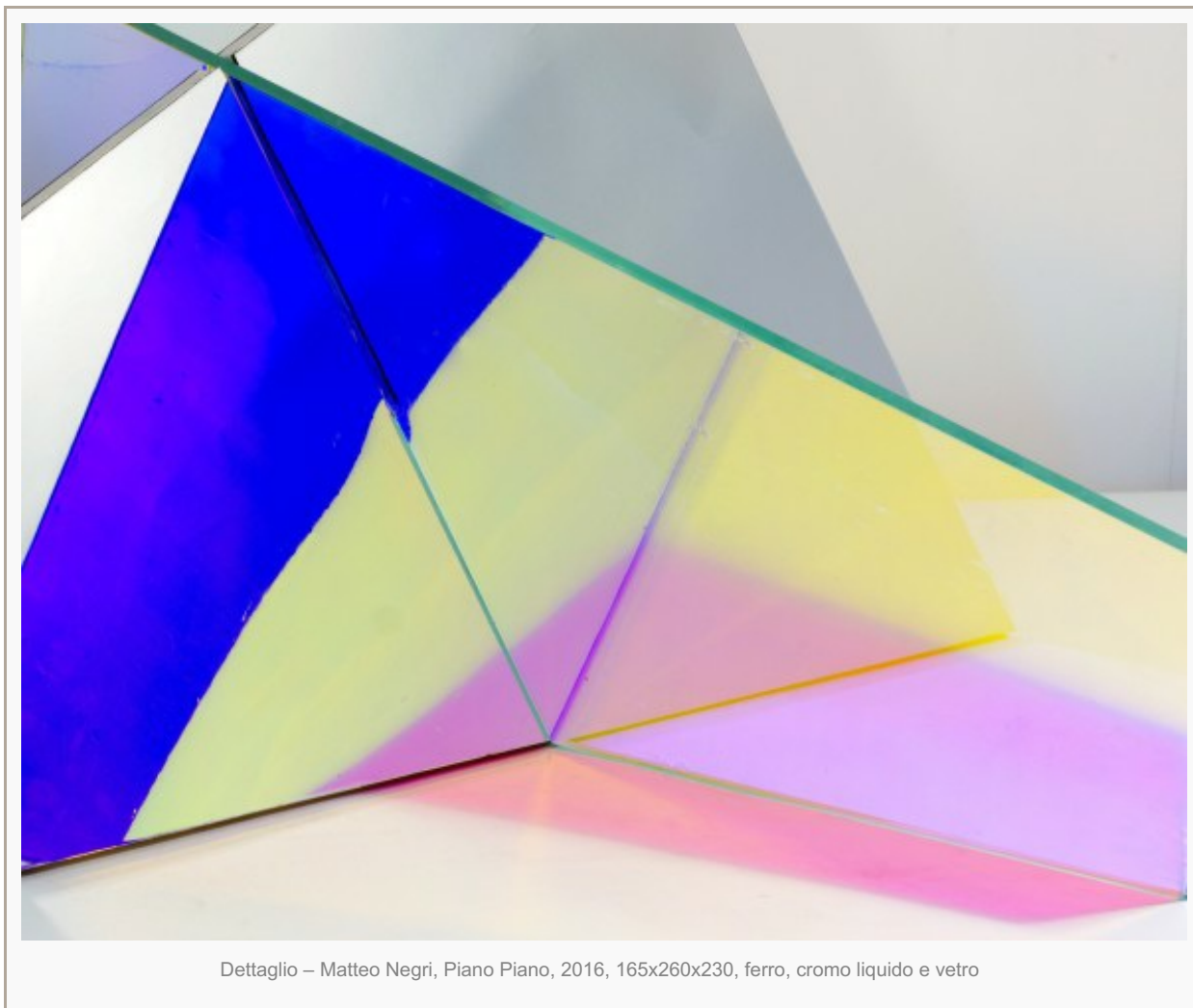
Dettaglio – Matteo Negri, Piano Piano, 2016, 165x260x230, ferro, cromo liquido e vetro

La scalinata di accesso della galleria, così come la prima sala, documentano il progetto realizzato per la città di Genova. Attraverso lavori che analizzano le architetture e i contesti urbanizzati, l'artista indaga la relazione tra spazio comune e immagine condivisa del vissuto collettivo.